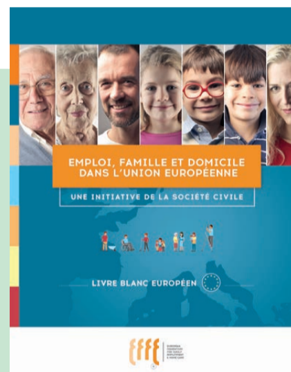
Livre Blanc européen

Active depuis plus d'un dizaine d'années à Bruxelles, la FEPEM a impulsé il y a 5 ans la création de la Fédération Européenne des Emplois de la Famille dont l'objectif est de favoriser la structuration de l'emploi à domicile à l'échelle européenne.