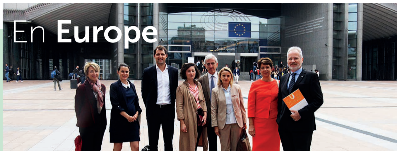
Le groupe de travail de l'EFFE devant le Parlement européen