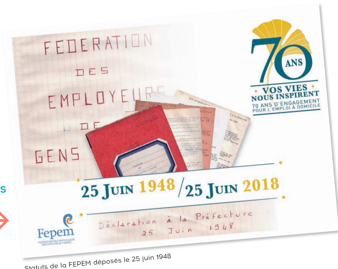
Statuts de la FEPEM déposés le 25 juin 1948

ASSEMBLÉE GÉNÉRALE LE 25 JUIN 2018 SOIT 70 ANS JOUR POUR JOUR APRÈS LA DÉCLARATION EN PRÉFECTURE →