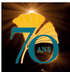
Label des 70 ans de la FEPEM