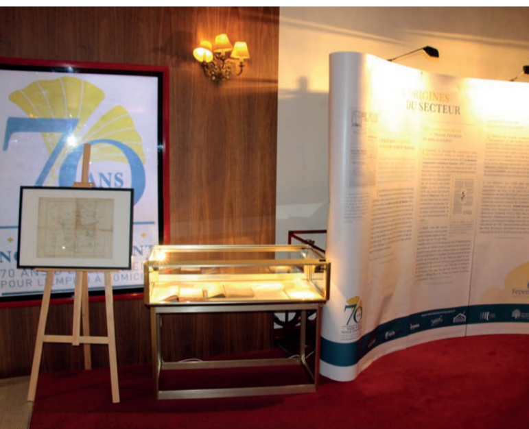
Un des 12 panneaux thématiques