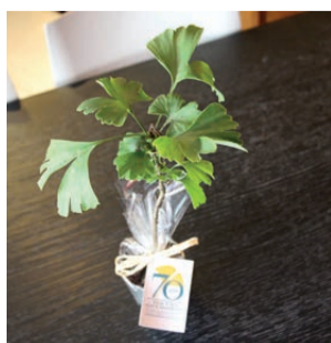
Plant de Ginkgo biloba

Nous avons choisi de symboliser cette année anniversaire par la feuille de ginkgo biloba. Arbre oriental millénaire, il est réputé pour sa longévité. C'est l'arbre du mieux vivre et du mieux vivre plus longtemps. Placés sous le signe de cet arbre ancestral, entrons de plain-pied et avec enthousiasme dans une nouvelle ère, où le lien humain rencontre la robotique et l'intelligence artificielle, où le parcours de vie de chacun s'appuie sur l'emploi viable et responsable, où la rencontre intergénérationnelle est au cœur du projet de société de demain.